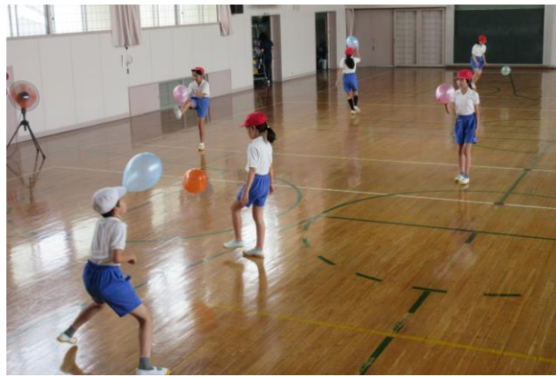
間を空けて、運動します。

梅雨に入り、じめじめとした蒸し暑い季節になりましたが、教室のエアコンの効いた教室では、快適に過ごしています。人数が少ないとはいえ、みんなで「3密」にならないよう声をかけ合い元気いっぱいに活動しています。