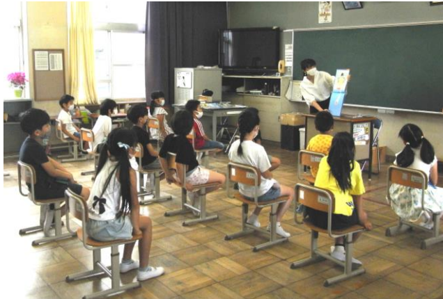
ボランティアさんによる読み聞かせも始まりました。