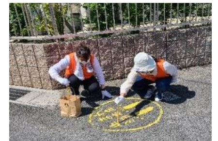
スペシャルクイズの答え：かばん