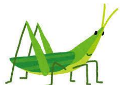
晴れた日は、生きもの探しに夢中です！